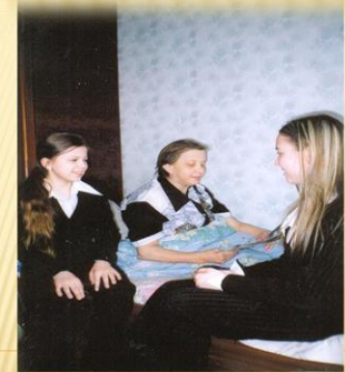
КЕШЕЛӘРНЕ СӨЕНДЕРҮ – ОЛЫ БӘХЕТ